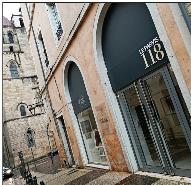
Le Parvis 118