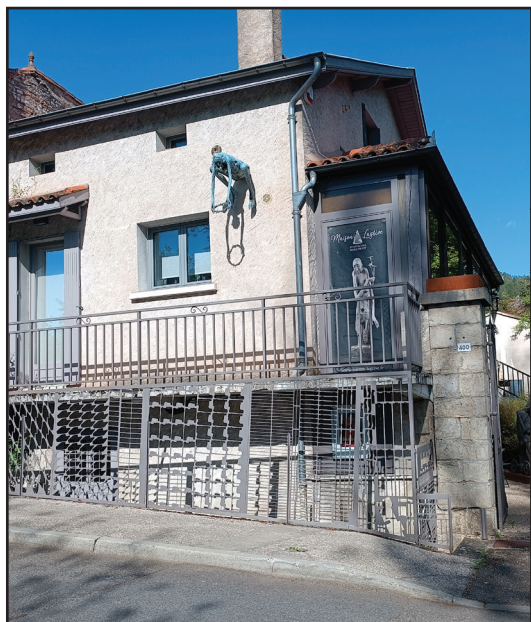
La Maison Lagrive

Deux sites d'exposition sont dédiés aux petits et moyens formats : La Maison Lagrive , showroom Marc Petit, lieu permanent ouvert depuis 2019 et la salle d'exposition Le Parvis 118 où seront exposées les pièces récentes.